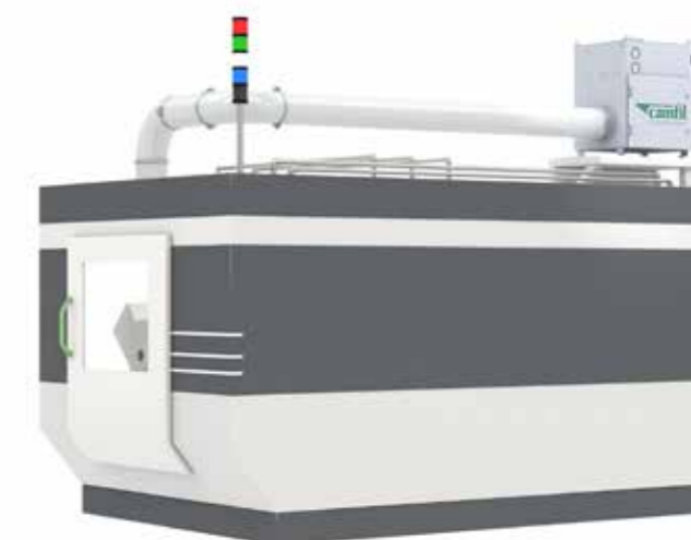
Integration in Werkzeugmaschine